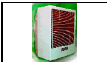
Resfriador evaporativo – Industrial